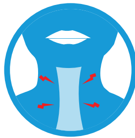
Dolor de garganta