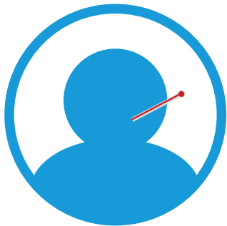
Fiebre y/o escalofríos